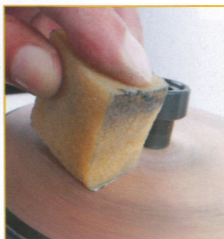
Um die Lebensdauer der Schleifbeläge zu verlängern, werden sie mit dem mitgelieferten Kreppwürfel gereinigt