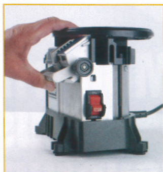
Durch einfaches Anheben der Zuführung wird der Schleifwinkel jeweils in 5°-Schritten verändert und gerastet